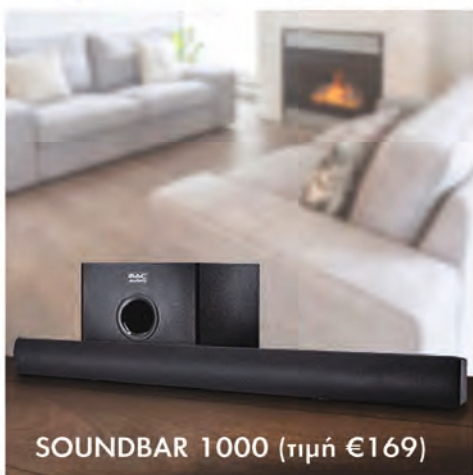
SOUNDBAR 1000 (τιμή €169)