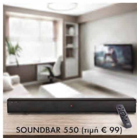
SOUNDBAR 550 (τιμή €99)