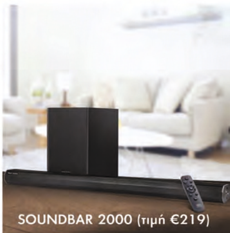
SOUNDBAR 2000 (τιμή €219)