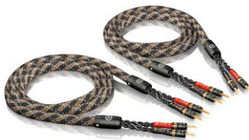
SC-4 单线 T6s 音箱线