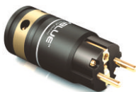
IEC C15 插口 ¥548 | 1只 型号: 30605