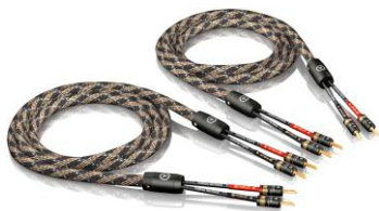
SC-2 单线 T6s 音箱线