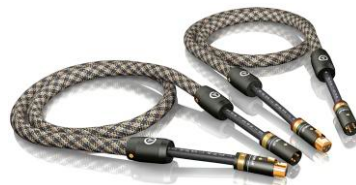
NF-S6 XLR线 T6s NF 数码线