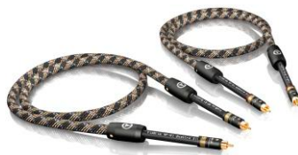
NF-S1 RCA T6s NF 数码线