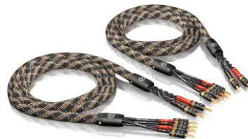
SC-4 双线 T6s 音箱线