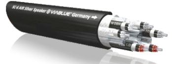
SC-6 AIR 镀银系列 音箱线