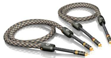
NF-S6 RCA T6s NF 数码线