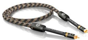
NF-B 低音炮线 NF 数码线