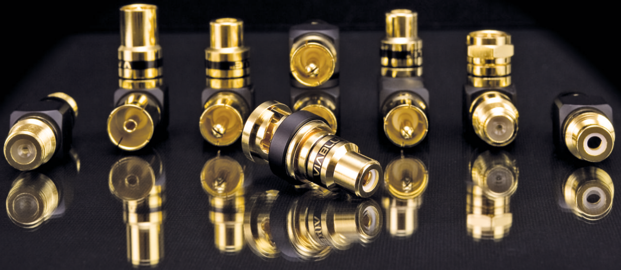
RCA 转接头 90° S ¥110 | 2 只 型号: 40615