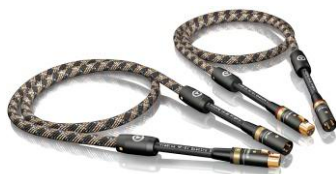
NF-S1 XLR线 T6s NF 数码线