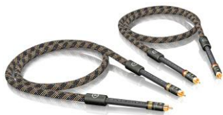
NF-A7 RCA T6s NF 数码线