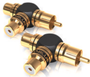
低音炮 Y 转接头 ¥102 | 1 只 型号: 40690